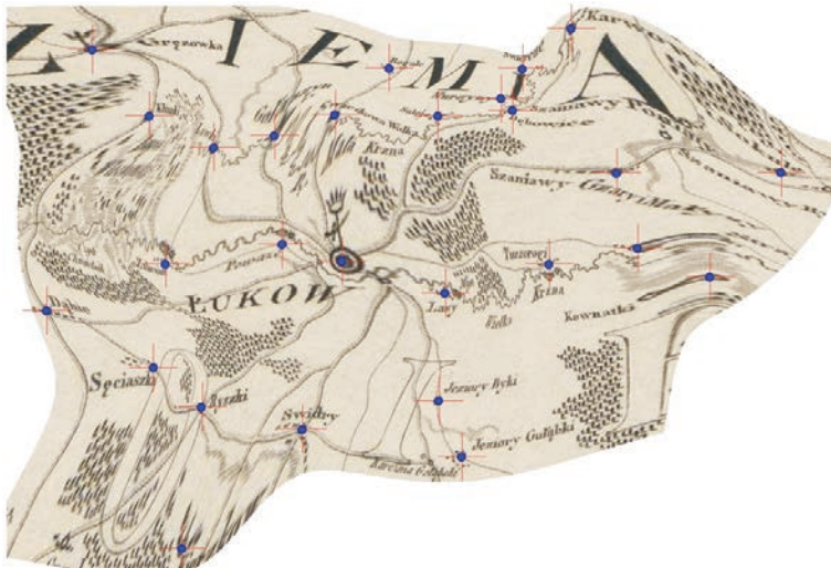
Ryc. 2. Deformacja fragmentu Mapy szczególnej województwa lubelskiego po nadaniu georeferencji w odwzorowaniu stożkowym równoległościowym

macji geograficznej, ze względu na ich małą wiarygodność, jest bardzo trudne. Także dla terenów Polski za przełomowe należy uznać prace kartografów państw zaborczych. Wynikało to zarówno z postępu wiedzy kartograficzno-geodezyjnej, jak też rozwoju technologicznego oraz zastosowania nowych instrumentów pomiarowych.