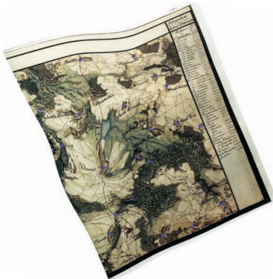
Ryc. 3. Deformacja zdjęcia wojskowego Galicji Zachodniej z lat 1801–1804 po nadaniu georeferencji w odwzorowaniu Cassiniego

Aby wykorzystać dawne mapy jako podkład do przygotowania map historycznych, należy nadać im poprawną georeferencję. Należy pamiętać, że istnieje wiele sposobów zapisu odwzorowań (Proj4, ESRI WKT, OGC WKT itd.). Ich opisy gromadzi organizacja European Petroleum Survey Group (EPSG, http://spatial-reference.org/ ). Większość aplikacji GIS wyposażona jest w narzędzia pozwalające nadać obrazom rastrowym współrzędne geograficzne. Oprócz najczęściej wykorzystywanych odwzorowań dają one także możliwość zdefiniowania własnego odwzorowania. Poważ-