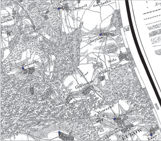
Ryc. 4. Deformacja fragmentu mapy Kwatermistrzostwa z lat 1822–1843 po nadaniu georeferencji w odwzorowaniu Bonne'a

historycznych informacji dla przygotowania atrybutów opisowych w bazie danych można czerpać także z licznych opracowań historycznych i informatorów historyczno-geograficznych. Systemy informacji geogra-