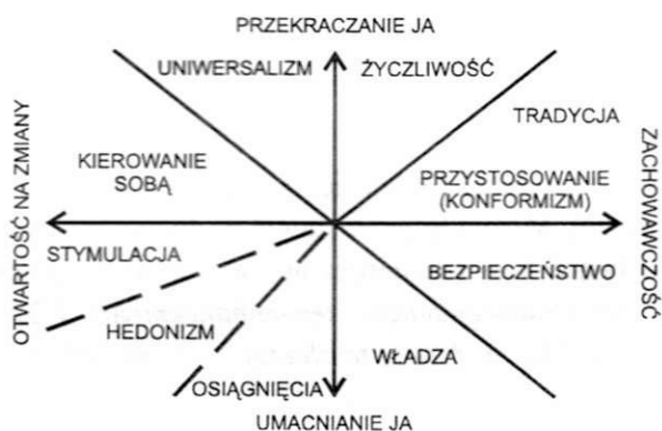
Rys. 2. Uporządkowanie kategorii wartości w dwuwymiarowej przestrzeni, którą tworzą: OTWARTOŚĆ NA ZMIANY – ZACHOWAWCZOŚĆ i PRZEKRACZANIE JA – UMACNIANIE JA (za: Schwartz, 1992b; zmodyfikowana Fig. 5, s. 45)

Oczywiście poszczególne kategorie, spośród dziesięciu wcześniej opisanych, są również przeciwstawne sobie, skoro na rys. 2 umieszczono je na przeciwko sobie. Przeciwstawne w tym sensie, że – jak wcześniej wspomniano – nie da się realizować ich równocześnie i nie mogą równocześnie być bardzo cenione przez jedną osobę. Nie da się na przykład pogodzić ze sobą wartości stymulacji i bezpieczeństwa czy życzliwości i hedonizmu.