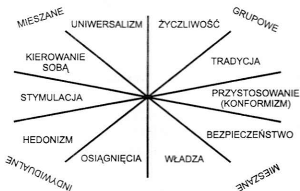
Rys. 1. Uporządkowanie kategorii wartości według zasady interesów (za: Schwartz, 1992b; zmodyfikowana Fig. 1, s. 14)