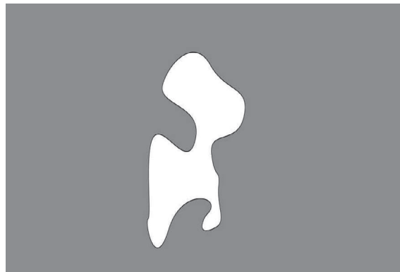
Rysunek 1. Przykładowy obiekt wykorzystany w eksperymencie rotacji.