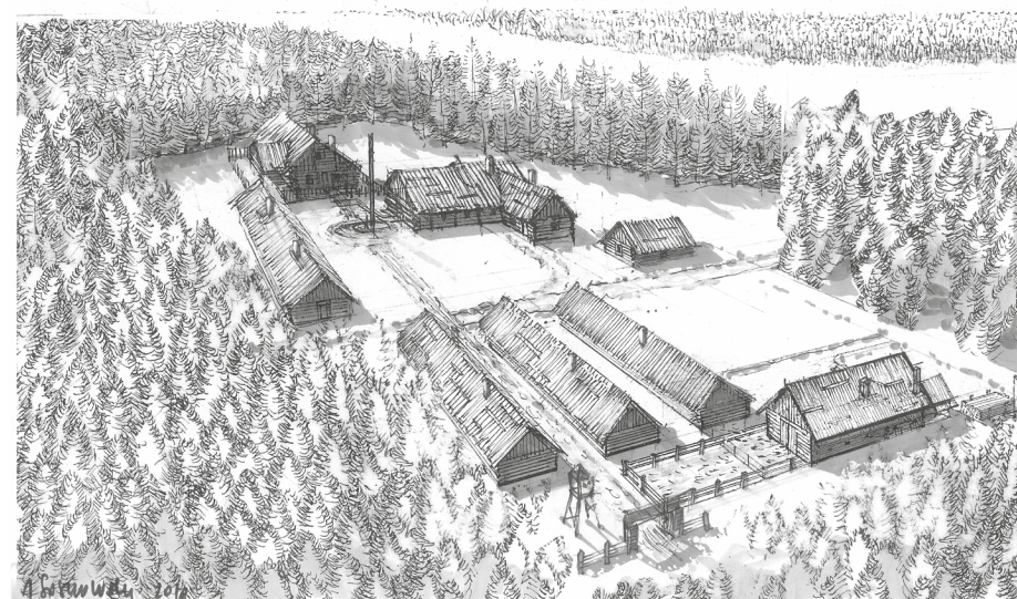
Gułag, szkic do scenografi filmu: „Syberia polska” | 2013