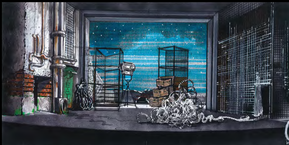
Koty | 2004

Wieloletni wykładowca w Państwowej Wyższej Szkole Filmowej, Telewizyjnej i Teatralnej w Łodzi. Obecnie w Akademii Sztuk Pięknych w Warszawie.