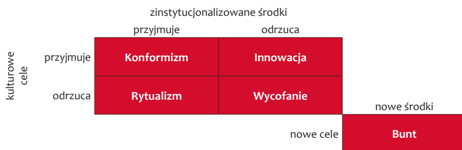
Rysunek 1. Typy przystosowania według teorii Mertona.

Poza przystosowaniem prospołecznym – niedewiacyjnym – Merton wyróżnił cztery typy przystosowania dewiacyjnego: innowację, rytualizm, wycofanie oraz bunt (patrz rysunek 1).