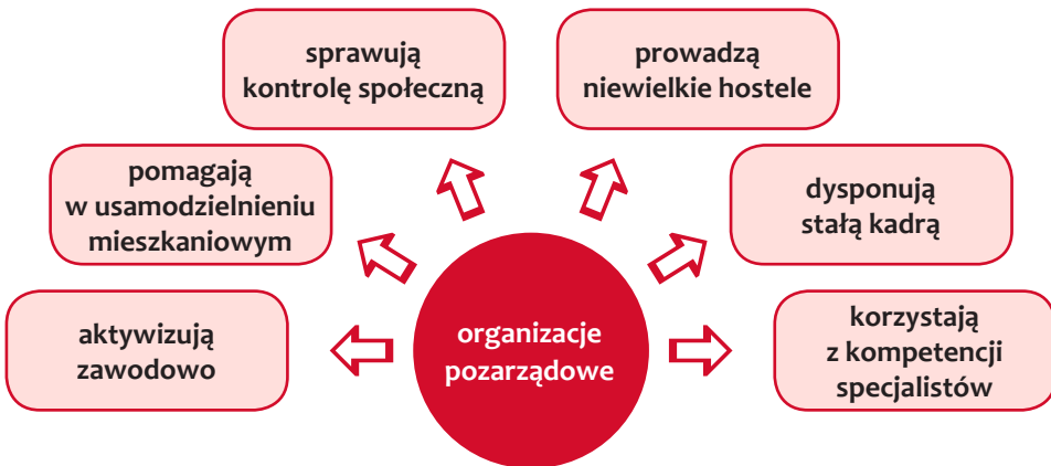
Rysunek 4. Znaczenie organizacji sektora pozarządowego w przeciwdziałaniu recydywie ze względu na spełniane kryteria.

Nie do przecenienia w procesie reintegracji zawodowej i społecznej osób skazanych, jest rola organizacji pozarządowych. Rola sektora pozarządowego została na tyle doceniona, że w Kodeksie karnym wykonawczym znajduje się przepis (art. 43), który stanowi, że stowarzyszenia, fundacje, organizacje i instytucje, o których mowa w art. 38, paragraf 1 Kkw, mogą otrzymywać z Funduszu przeznaczanego na pomoc postpenitencjarną środki na udzielanie pomocy, w tym na zapewnienie czasowego zakwaterowania osobom zwolnionym z zakładu karnego lub aresztu śledczego. System penitencjarny jest wzmacniany działalnością organizacji pozarządowych zarówno o zasięgu krajowym jak i lokalnym. Szczególnie ważne są te organizacje, które podejmują się pomocy wobec osób osamotnionych, nieporadnych życiowo, wymagających aktywizowania do działania i kontroli. Niezbędne dla przeciwdziałania recydywie są te placówki, które spełniają kryteria wymienione na schemacie poniżej (Iwanowska, 2013; Dybalska, 2007). Ważnym aspektem jest fakt, że te organizacje pozarządowe, które świadczą wsparcie osobom skazanym, znają specyfikę środo-