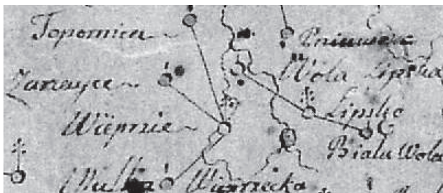
Ryc. 3. Fragment mapy (parafie Lipsko i Wieprzec)