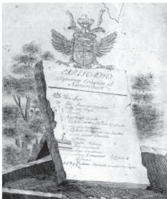
Ryc. 2. Legenda mapy