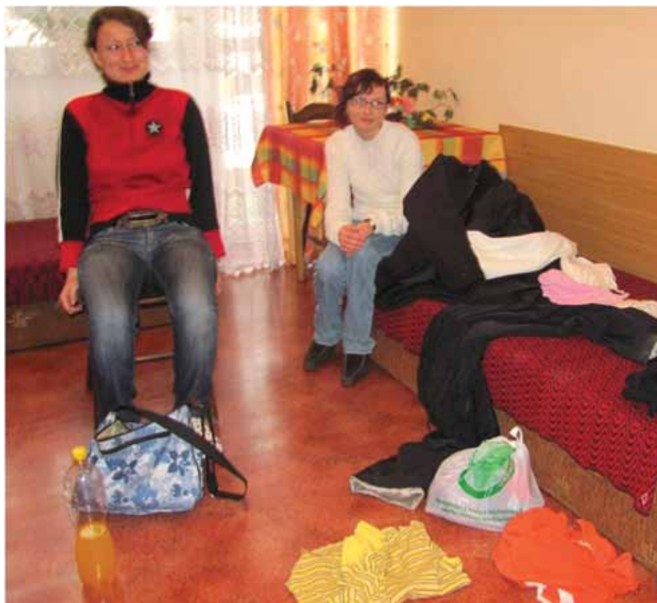
Bałagan (straszny) w pokoju dziewczyny.