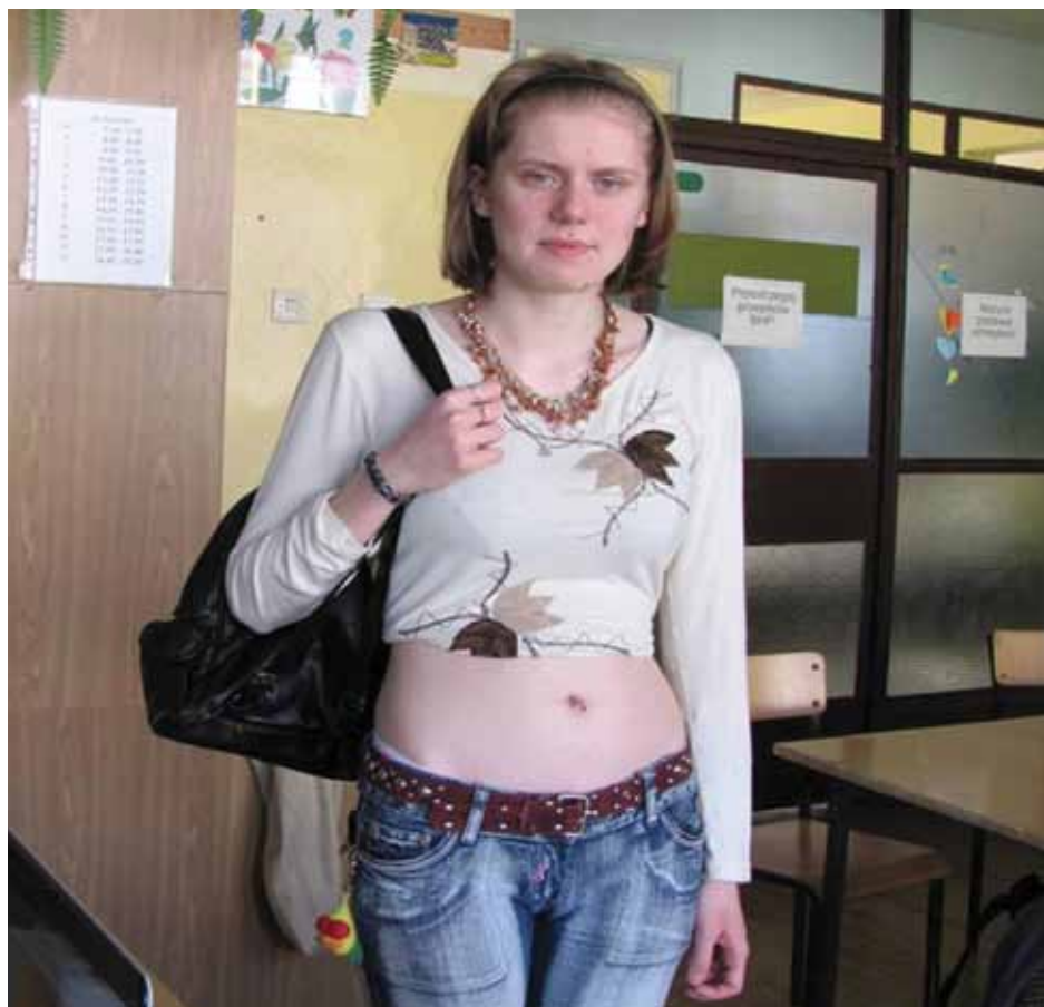
Ubrana niestosowanie dziewczyna szuka pracy.